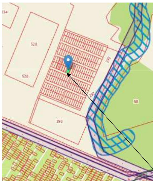
Рис.3. Выкопировка из публично – кадастровой карты земельных участков города Воткинска

Земельный участок с кадастровым номером 18:27:070002:517