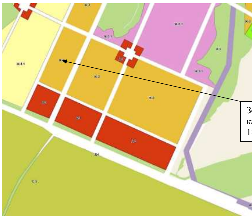
Рис.2. Выкопировка из ПЗЗ г.Воткинска.

Предельные размеры земельных участков, предельные параметры разрешенного строительства, реконструкции объектов капитального строительства зоны Ж-2, применяемые для объектов индивидуального жилищного строительства (код 2.1):